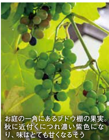
お庭の一角にあるブドウ棚の果実。秋に近づくにつれ濃い紫色になり、味はとて甘くなるそう

最後に、「モミジや桜などの落葉樹は、秋までに枝葉を剪定 せんてい しておくことで、落ち葉の量が減ってお掃除が楽になるんですよ」とご依頼いただくタイミングのこだわりについても教えてくださったO様。終始笑顔でお話になるお姿を拝見して、自然の恵みにあふれたお庭が、朗らかなお人柄と重なるように感じました。