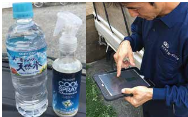
作業開始前に、本部から配信された情報を確認するとともに、スケジュールにあわせて、水分など十分に準備をしたうえで作業しております