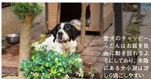
愛犬のチャッピー。ふだんはお庭を自由に動き回れるようにしており、木陰にある犬小屋は涼しく過ごしやすい

お客様とのコミュニケーションを大切にしています。音が出る機械を使うときは、チャッピーへの気づきも忘れずに作業しています。