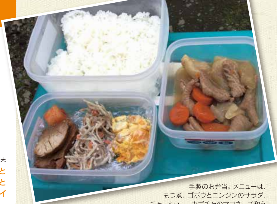
手製のお弁当。メニューは、もつ煮、ゴボウとニンジンのサラダ、チャーシュー、カボチャのマヨネーズ和え

仕事中の貴重なリラックスタイムであり、人となりが出やすいという食事時間。お客様の前とは少し違った、「昼飯」どきの植木カットデザイナーたちをご紹介します。