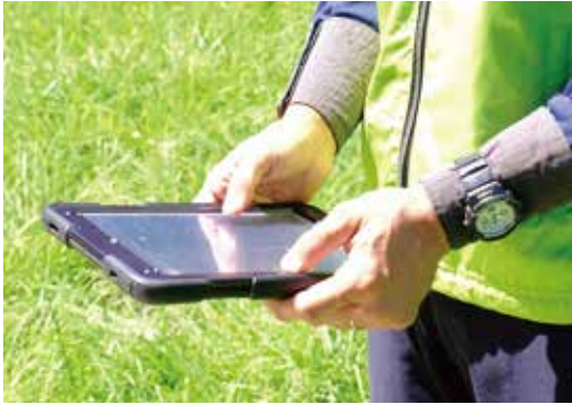
カットデザイナーが所持しているiPadは作業の進捗管理だけでなく、安全喚起にも利用しています