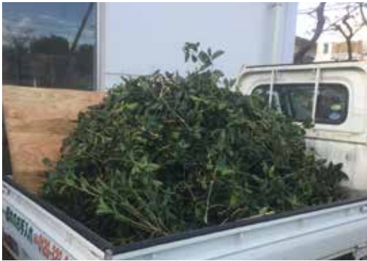
お手入れで発生した枝葉はご要望に応じてお引き取りいたします

また、樹木の枝や葉、草は枯れたあとに土に還るといった特性を持っています。当社では、皆様のお庭で枝葉をリサイクルできるように仕組みづくりをしています。ご期待ください！