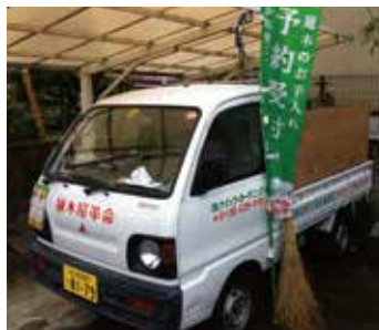
創業当時の軽トラトラック

あるとき、植木カットデザイナーの家にいくと、軽トラトラックのマグネットシートがはがされていきました。本人に聞くと「あなた植木屋さん？」と近所で声を掛けられるのが煩わしいと言っ