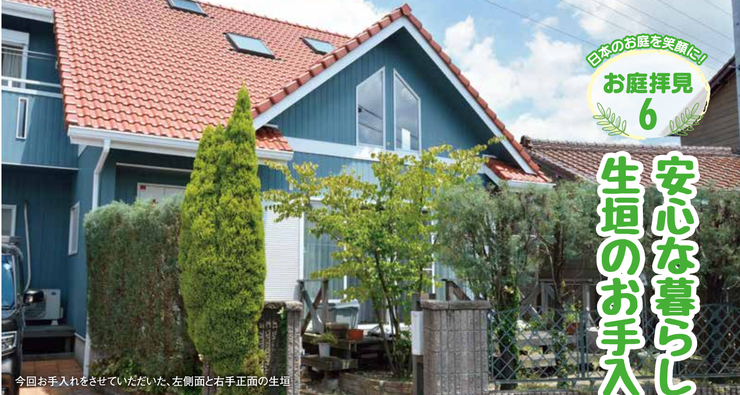
今回お手入れをさせていただいた、左側面と右手正面の生垣