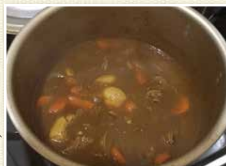
右：カレーの具材も煮崩れせず、このとおり！