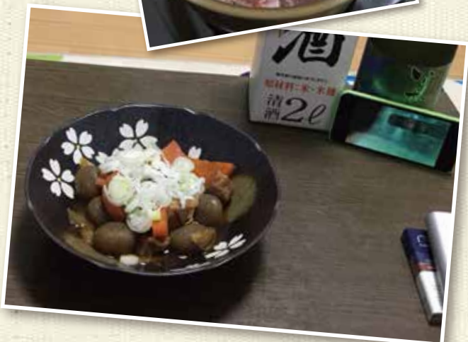
左上：仕込み中のハラミと玉こんにやくの煮物 左下：スマートフォンで海外ドラマを鑑賞しながら、手作りのおつまみで晩酌