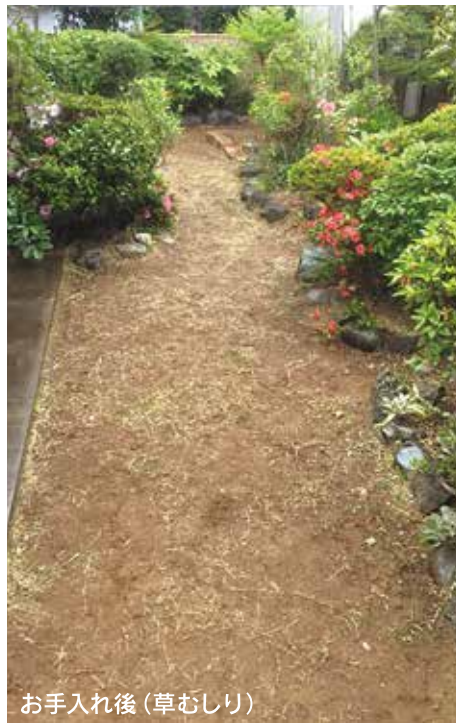
お手入れ後(草むしり)