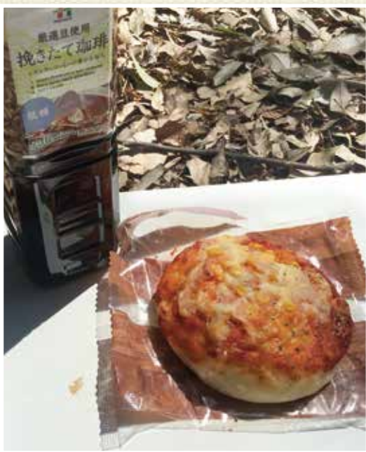
作業中は水やスポーツドリンクで水分補給しますが、 ランチではコーヒーを楽しんでいる