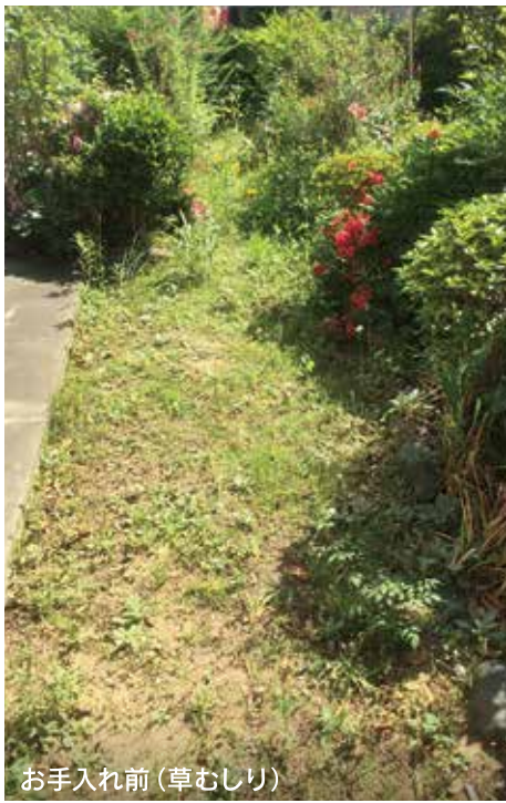
お手入れ前(草むしり)

春から夏にかけては草木の成長期。もちろん、雑草も旺盛に育ちます。適切な除草方法を知って、きれいな住環境を保ちましょう。