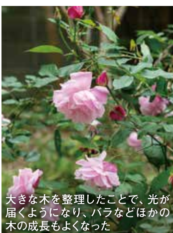
大きな木を整理したことで、光が届くようになり、バラなどほかの木の成長もよくなった