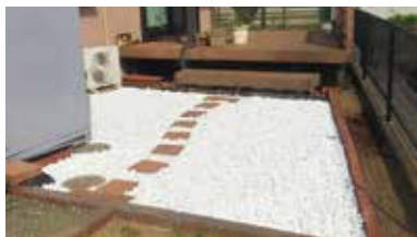
〈防草シート施工付き〉

クイック・ガーデニングでは、より除草効果を高めるために、「防草シート」を敷いた上に砂利を敷き詰めます！