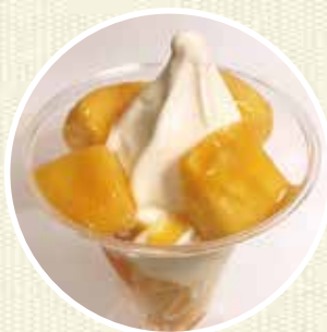
コンビニスイーツで パワーチャージ