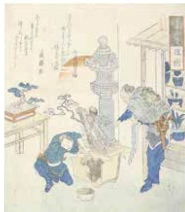
左: 木製の植木鉢に防錆を塗る植木屋 右: 植木屋が鉢植えを売る様子

お客様のニーズに答えていて、「植木職人は植木鉢なんかいいじゃない」なんてもってもらいたい意見に惑わされていた自分を反省しました。