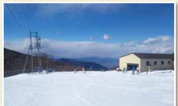
菅平高原スノーリゾート(長野県)のゲレンデにて