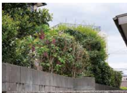
お隣との境界は、枝葉がなるべく飛び出ないように剪定している

お客様のご要望をよくおうかがいして、ご希望にあわせたお手入れができるよう心がけています。