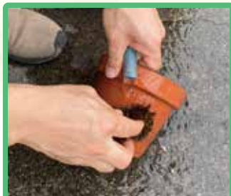
1 汚れを落として キレイにします

私たちは古い植木鉢に 新しい価値を見だし、 持続可能な資源循環の 実現を目指しています。