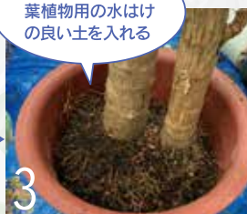
3 鉢底石を入れ、観葉植物用の水はけの良い土を入れる