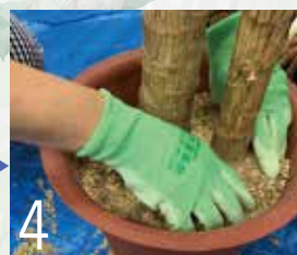
4 鉢のふちの土を押し込めるように指を差し入れ固める