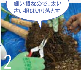
2 腐ったり色が変わった根は取り除く