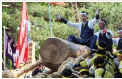
◀諏訪大社の御柱祭「モミの巨木」の祭りに興味をもち、すっかり大ファンに!

「★」評価制度:植木カットデザイナーとしての経験を積み、接客・技術・安全の分野において所定の試験に合格した者に「★」を付与しています