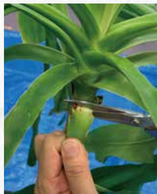
葉を下にグイと引き、幹に刃を近づけて切り取る

り込めるようにします。葉を切る際には、できるだけ幹の近くにハサミを入れ、刈り取っていきます。