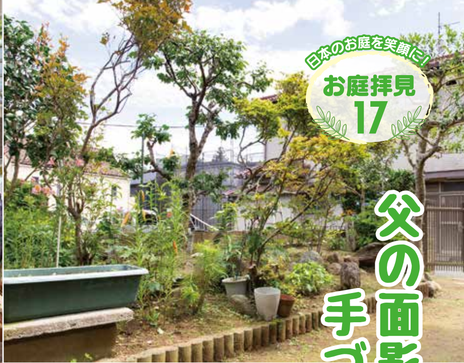
亡きお父様が一からつくりあげたお庭