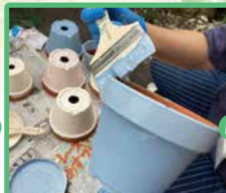
3 ミルクペイントで色付け