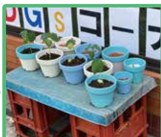
6 本社前で お配りしています

捨てられるはずだった古い 素焼き鉢がオシャレに生ま れ変わり、新たなお客様の 元で使われています。