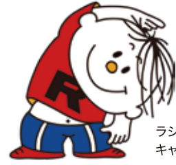
ラジオ体操のイメージキャラクター「ラタ坊」

だれでも一度はやったことのあるラジオ体操。 なぜ国民的体操にまで普及したのか？ 1回たったの3分で 老若男女すべての人が無理なく健康増進効果あり。 じつはスゴイ！ ラジオ体操をご紹介します。