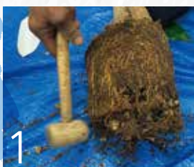
1 ハンマーなどでやさしく土を崩す