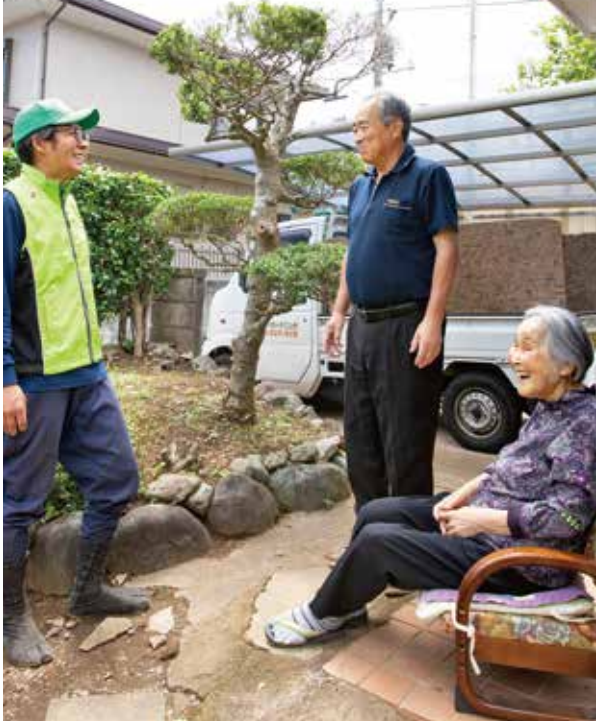
お庭の重鎮(ツゲ)を囲んで団らんのひととき