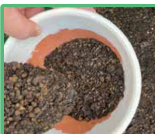
4 剪定枝で作った自社製 腐葉土を入れます