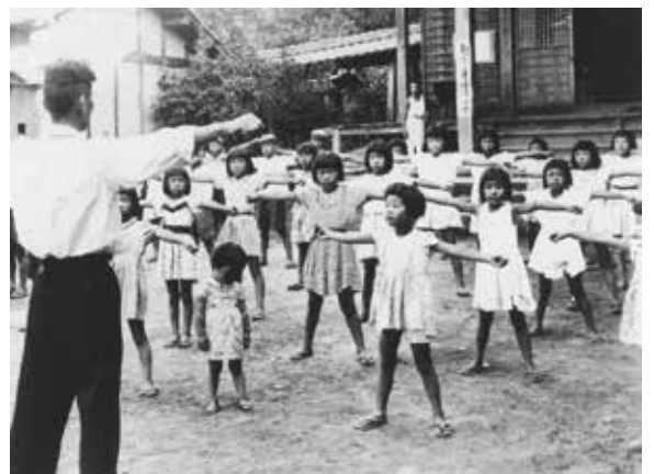
ラジオ体操をする昭和の子供たち（岐阜市）