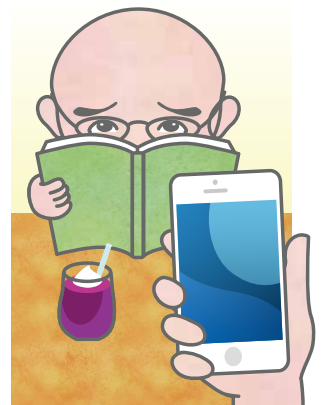
イラスト:編集部 塩田