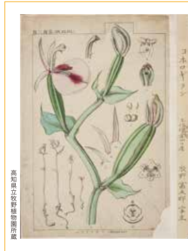
高知県立牧野植物園所蔵

日本に自生する植物をまとめた本。植物図を描く名手でもあった博士。植物の特徴がすべて1枚の図に描かれる。印刷に使用する版も自作したもの。