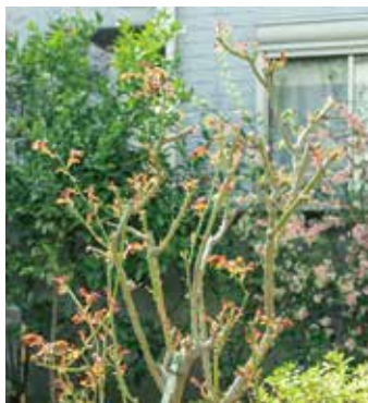
義父母が植えた薔薇を初めて剪定。無事に芽が出て大輪の花を咲かせた

「趣味はガーデニングと言えるようになり、義父の残した庭を大切に、自分なりに楽しんでみます」とO様。慣れない