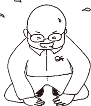
イラスト：編集部 鹿嶋