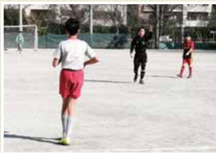
公式戦では審判を買ってです。そのために審判資格も取得しました