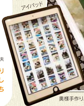
奥様手作りお弁当をアイパッドで毎日写真に撮り、記録しています