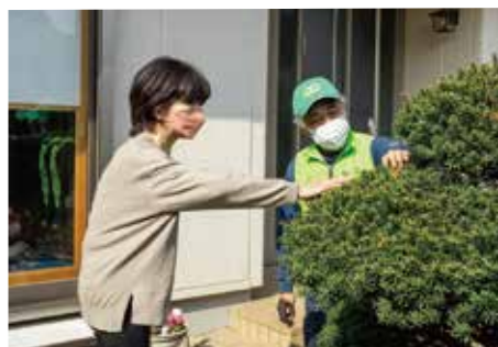
大切なキヤラボクはプロにお手入れを相談。仏壇からお庭が見えるよう、雪見障子を開けている