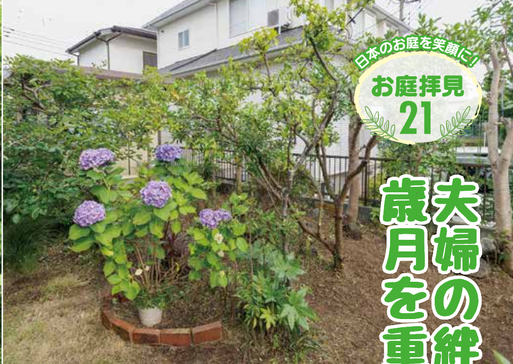
作業後の庭 (剪定と除草)