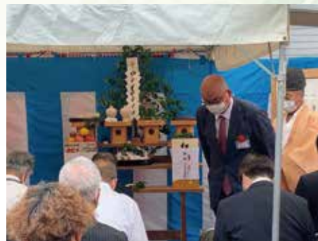
「滝川ファーム修善寺安全研修センター」開所式の様子

その一環として空き家と農地を借り受け、建物は宿泊研修施設としてリノベーションし、畑は様々な技術研修ができるように整備しました。