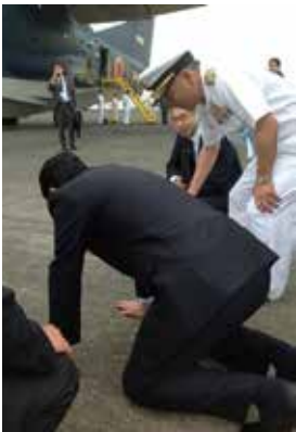
四つん這いでお詫びする安倍元総理