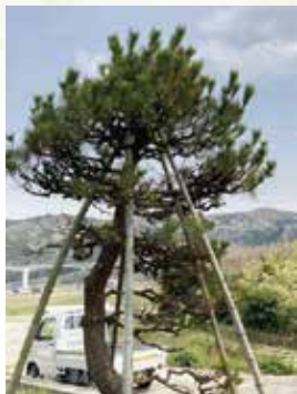
耕作放棄地に樹木を植えて剪定の研修をしています

現在全国の空き家数は848万戸にもものぼり、少子高齢化の進行とともに年々増加しています(平成30年 総務省、住宅土地統計調査より)。実家を離れて遠方に暮らしている場合、両親の自宅(実家)を相続しても、誰もその家に住む人がいなくなってしまうケースが多いようです。