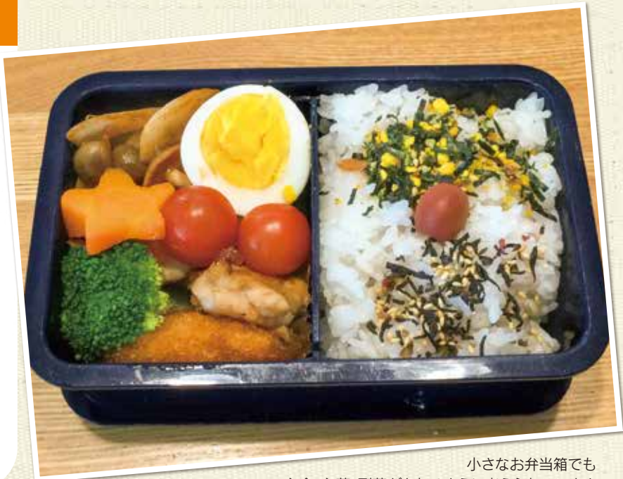
小さなお弁当箱でも主食、主菜、副菜がとれるように考えられています

仕事中の貴重なリラックスタイムであり、人となりが出やすいという食事時間。お客様の前とは少し違った、「昼飯」どきの植木カットデザイナーたちをご紹介します。