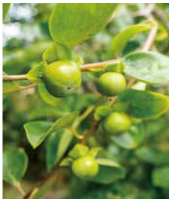
毎年、秋に収穫するお庭の甘柿

今から四十数年前、Y様は分譲地販売の抽選に当たり、それまで住んでいた団地から庭付き一戸建てへ家族四人で移り住みました。庭づくりのため、当時よく開かれていた植木市に夫婦でなんども足を運んだそうです。「お庭のある暮らしがうれしくなっちゃって」と市が開かれるたびに苗木を購入。山茶花、椿、金木犀、千両、八ツ手、木蓮など次々と夫婦で植えてお庭をつくっていききました。二人で植えた柿の木は大きく育ち、毎年甘い実をたくさん付けま