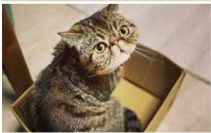
上：昨年末に購入したばかりの愛車 下：愛猫のエキゾチックショートヘア「もんじゃくん」