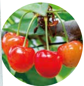
「日本一のさくらんぼの里」大粒の「紅秀峰」は寒河江生まれ

山形では来客を出前のラーメンでもてなします。お客さんが来た日は「今日はラーメン♪」とウキウキ