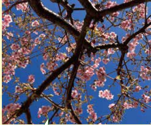
東京都 H様 毎年剪定をしていただいている河津桜です。今年はずっとより多く花が咲きました

編 お客様との出会いも当社の大切な財産です。感謝を忘れず、誠実に努めてまいります