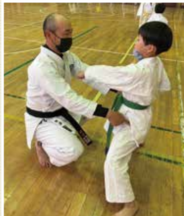
週2回稽古に励む野澤親子

仕事をするうえで「コミュニケーションを大切にしています。同じ言葉でもお客様がイメージされる仕上がり姿はさまざま。」「さっぱりさせたい」「ちょっと低めに仕上げてください」「言葉の先にあるイメージを、しっかりと話を聞いて受け止めたい。そして、わすかでも期待を上回る仕上りにし、「お客様を笑顔にすることを目標に、これからも精進します」と話してくれました。