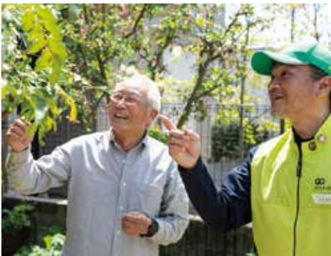
F様ご自身でも剪定をされるので小松にアドバイスをもらうことも

こそ、庭の手入れを助けていただき「というF様。その思いに、プロの技と心を込めた作業で応えてまいります。