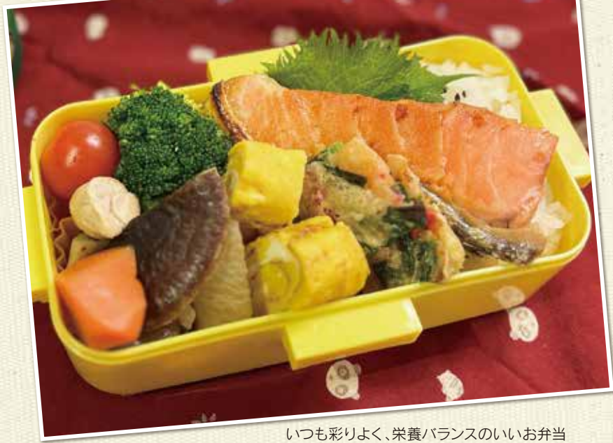
いつも彩りよく、栄養バランスのいいお弁当 この日は、一番の好物の塩鮭入り♪

仕事中の貴重なリラックスタイムであり、人となりが出やすいという食事時間。お客様の前とは少し違った、「昼飯」どきの植木カットデザイナーたちをご紹介します。