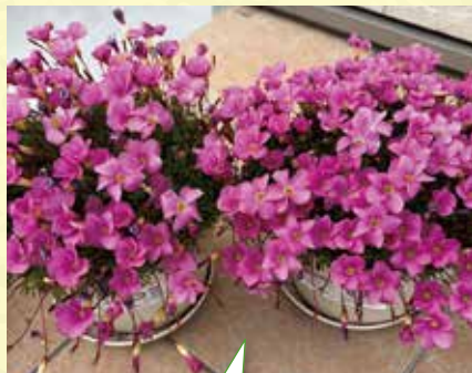
群馬県 T様 今年2年目のオキザリス。過酷な夏を乗り越えて見事に咲いてくれました