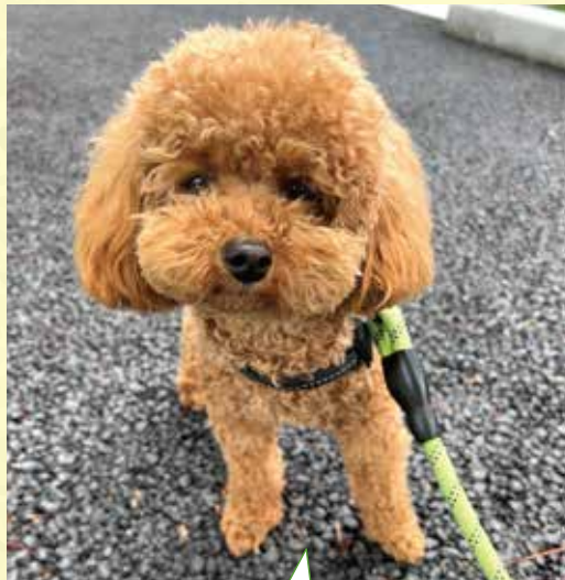
千葉県 M様 やんちゃな2歳のトイプードル「茶丸(ちやまる)」です