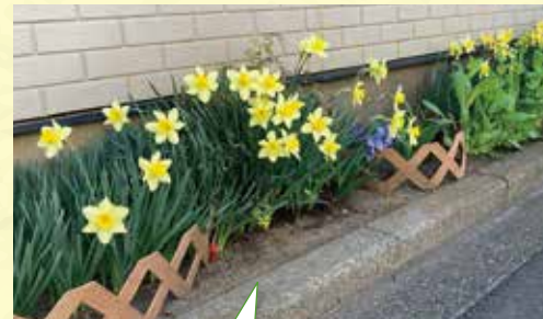
神奈川県 A様 毎年スイセンが咲いてくれます。今年はこれでも半分のみです