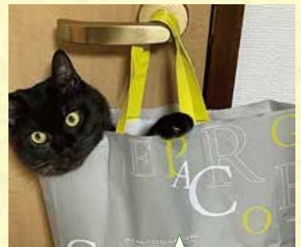
栃木県 K様 体重を量るとき、袋に自ら入ります。ついでにドアノブに下げてみました