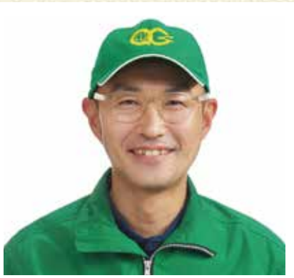
植木カットデザイナー