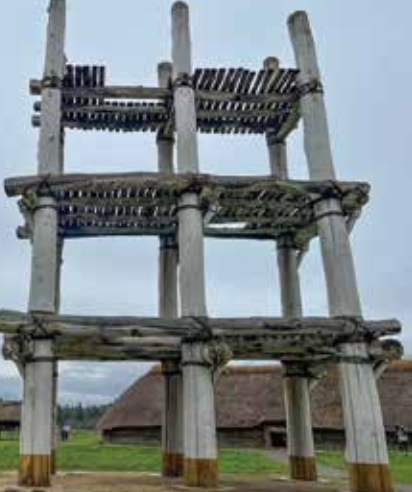
写真1: 復元した三階建て

ここは東京ドーム約9個分の広さで、竪穴式住居がたくさん建てられていました。土を貼ることで舗装された道路