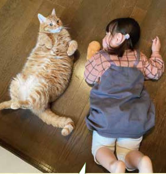
群馬県 I様 孫と飼い猫「トラ」とのツーショット