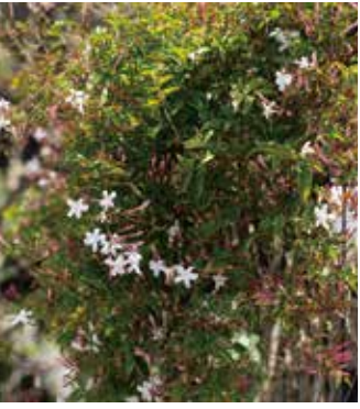
ハゴロモジャスミンのかわいらしい花から甘い香りが漂う

ご家族はみな愛猫家。17年前にマンションから移り住むとき、猫たちが過ごしやすいよう設計したのだとか。どの部屋にもキャットスルー(猫が通る)