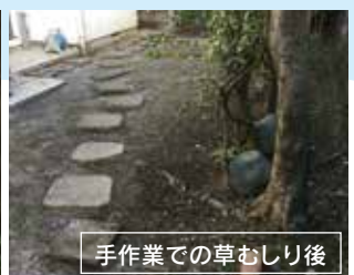
手作業での草むしり後

の分手間をかけて細かい部分まで丁寧に仕上げます。庭石や植栽を傷付ける心配もありません。