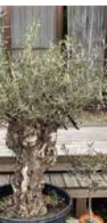
江郷作：オリーブ盆栽（樹齢50年）