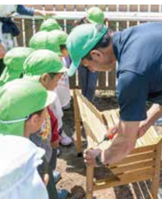
組み立て作業も学びになっています