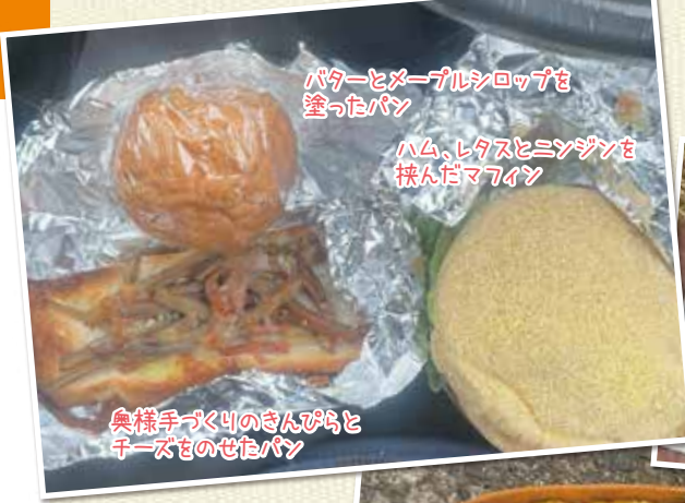
バターとマーブルシロップを塗ったパン

仕事の中の貴重なリラックスタイムであり、人となりが出やすいという食事時間。お客様の前とは少し違った、「昼飯」どきの植木カットデザイナーたちをご紹介します。