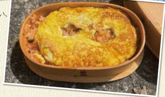
娘さん手づくり オムライス弁当