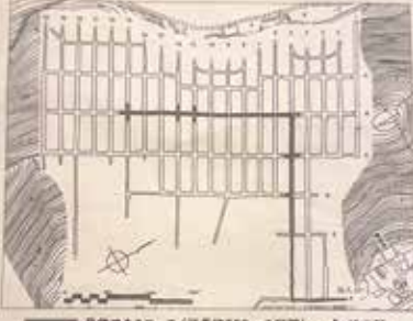
見学できるコース(延長約600mの区間) 松代大本営地下壕の現状

今の自分が生きていられるのは、先人の犠牲のおかげと思っしかありませんでした。すいません。